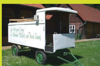
Foto: Milchwagen Gut Glinde

Im Lokschuppen des früheren Bahnbetriebswerkes Aumühle bei Hamburg präsentiert der Verein „Verkehrsamateure und Museumsbahn e.V.“ (VVM) historische Eisenbahnfahrzeuge. Lassen Sie sich an der legendären preußischen „T3“ in eine „Eisenbahnreise zu Großvaters Zeiten“ versetzen! www.vvm-museumsbahn.de