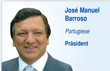
José Manuel Barroso