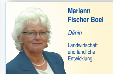
Mariann Fischer Boel